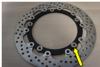
von innen einsetzen/insert from inside